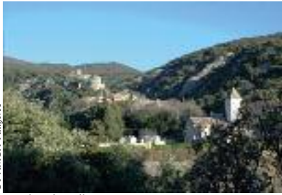
OT AMCH Fauères Vue de Cabrerolles

La troisième pénétrante, qui reliait Béziers à Cahors, a été redécouverte par G. Sahuc. Au Moyen Âge, elle a porté le nom de "Grand Cami Ferrat de la montanha au país bas" et, sous les intendants, celui de "Chemin de la Haute Guyenne".