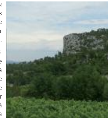
Paysages autour d'Agel