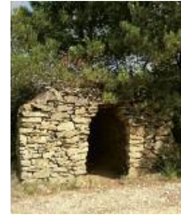
Capitelle, vers Aigues-Vives

5. 202 m, 31 T 487158 4800670 Quitter la route D 175 et emprunter à gauche le chemin de Chantovent sur 600 m. Passer un cabanon de vigne et au carrefour, continuer tout droit sur 300 m. Descendre à droite (vue sur la rivière) à travers vignes puis sous les pins. A la fourche, s'engager à droite sur le chemin qui devient ensuite un sentier. Au croisement suivant avec une piste, descendre à gauche et poursuivre tout droit après la vigne sur le large sentier empierré jusqu'à Paguignan. Au hameau, aller à gauche et rejoindre l'église et le parking.