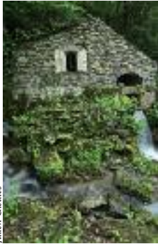
La source de La Cesse

Elle prend sa source un peu à l'écart du village dans la fraîcheur d'un sous-bois tapissé au printemps d'ail des ours. Son eau servait à alimenter, tout au long de son parcours, de nombreux ouvrages tels que moulins et piscicultures, visibles dans le village et en aval. Après avoir quitté la montagne, la Cesse coule au fond des gorges, au pied du causse jusqu'au village de Minerve puis continue son tracé pour se jeter dans l'Aude après une cinquantaine de kilomètres. Même si durant la période chaude l'eau disparaît à certains endroits, la source coule toute l'année à bon débit.