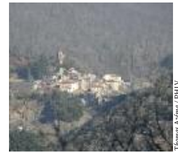
Ferrals les Montagnes

5. 541 m, 31 T 471418 4804295 Au carrefour, prendre la deuxième épingle sur la gauche, puis, après quelques dizaines de mètres, monter la piste à droite et poursuivre la montée. Ignorer les deux pistes arrivant de gauche. A la patte d'oie à découvert (vue à droite sur les Pyrénées), rester sur la piste de droite. Plus loin au croisement avec une route goudronnée, tourner à gauche. Au croisement suivant, prendre de nouveau à gauche et continuer jusqu'à Ferrals. A la route goudronnée, prendre à gauche et monter à droite dans le village pour rejoindre le parking sur la D 12 après la mairie.