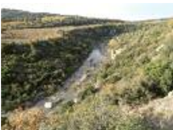
Paysage autour de La Caunette

En parcourant ce sentier vous constaterez que le village de La Caunette présente différents paysages. D'abord, les gorges de Coupiat, profondément taillées dans le calcaire, tranchent le territoire du nord au sud. Sur les plateaux en pente douce sont couverts de garrigue à chènes kermès, cistes, thyms, chènes verts... et quand le sol se fait plus profond, de