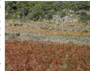
Vignoble en automne

2. 205 m, 31 T 469375 4797252 Après le passage bétonné, quitter le chemin et partir à gauche le long des vignes. Au croisement (cabanon de vigne), prendre à droite et rejoindre la route goudronnée. Se diriger à gauche vers le Domaine Sainte Eulalie, le contourner en restant sur la route. Monter et rejoindre la route de Calamiac le haut. Aller à gauche et traverser le hameau.