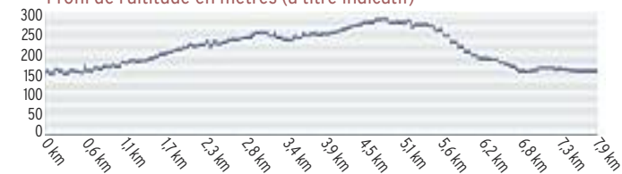
Profil de l'altitude en mètres (à titre indicatif)

Après 400 m, au niveau du virage à droite, tourner à gauche et continuer tout droit. Bien suivre le balisage. Après 50 m, à la fourche, continuer sur le sentier à droite vers les fours à chaux. Redescendre et profiter du panorama sur le lac de Jouarres, l'Alaric, les Corbières et par temps clair, sur les Pyrénées. Rejoindre un chemin bétonné, le suivre tout droit puis rallier une piste et la prendre à gauche. A la croix, continuer tout droit sur 30 m puis s'engager à droite sur le chemin des Bains et regagner le parking.