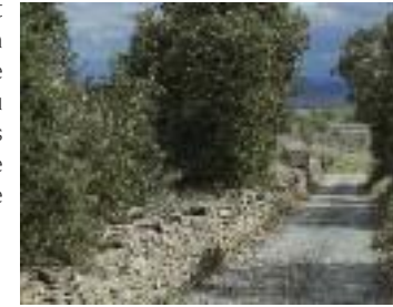
Autour de La Livinière

1. Du parking, traverser et prendre en face l'ancien chemin de Féline, route goudronnée puis en terre, qui suit le ruisseau des Mourgues, sur 1,5 km, puis continuer en longeant la vigne à droite, jusqu'au passage bétonné.