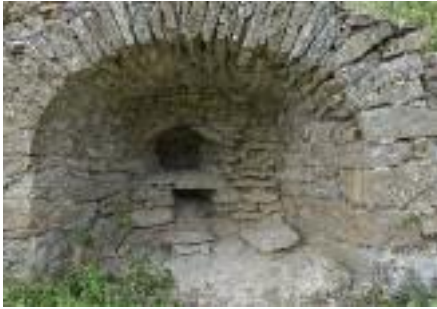
Four à chaux

Le fonctionnement des fours à chaux nécessitait une très grande quantité de bois ainsi que le travail de plusieurs personnes.