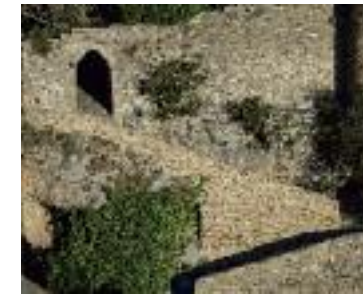
Minerve, porte basse

1. Du parking, descendre vers Minerve par la route goudronnée. Continuer par la rue de la Tour. A la Place du monument, descendre en face par la rue des Martyrs. En bas de celle-ci, prendre à gauche puis à droite, rue du Caire. Plus bas, tourner à gauche pour gagner les remparts. Passer ensuite par les escaliers métalliques et, en bas, aller à droite pour se rendre sur la passerelle et traverser la rivière.